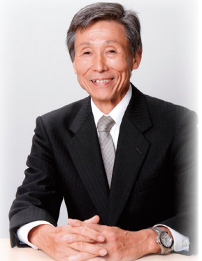
株式会社 さわかみホールディングス代表