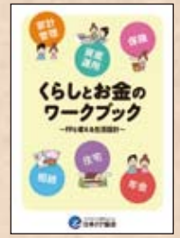
暮らしとお金のワークブック ～FPと考える生活設計～