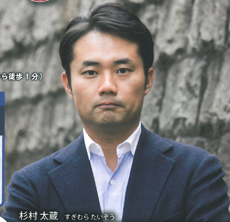
杉村 太蔵 すぎむら たいぞう