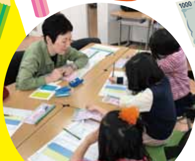
2018年3月 キッズビジネスタウン(千葉商科大学)