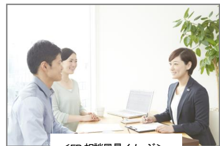
<FP相談風景イメージ>