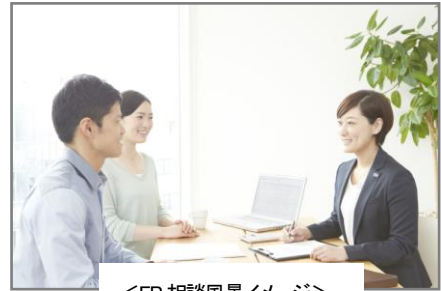
<FP 相談風景イメージ>