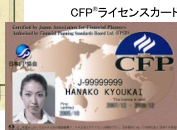
CFP®ライセンスカード