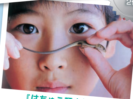
『はちゅう類大好き』 柴山和久 様（神奈川県）