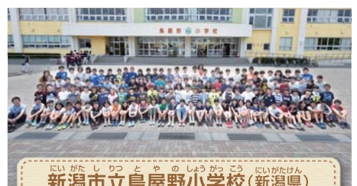
新潟市立鳥屋野小学校(新潟県) 児童132名