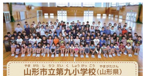
山形市立第九小学校(山形県) 児童119名

く道筋が見えます。自分自身でライフプランを考えシートにまとめること、その実現に向けて努力することが夢をかなえる鍵であることを学んだ授業でした。