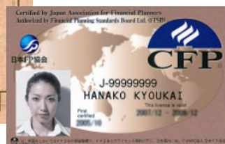
CFP®ライセンスカード